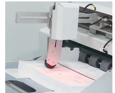
OMRモジュールはタワーフィーダー上部に取付けます。