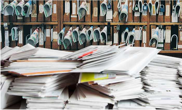
Traitement classique du courrier

instantanément des documents physiques sur place, puis de les livrer numériquement au destinataire visé. De plus, notre solution est 100% conforme à la réglementation en matière d'archivage. À l'échelle mondiale, des organisations telles que les banques, les agences gouvernementales et les hôpitaux ont adopté cette méthode moderne qui leur permet de gagner du temps.