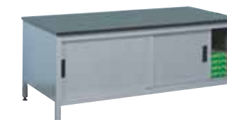
Table de rangement

Tables élévatoires. Ces solutions ergonomiques peuvent être adaptées afin d'accueillir de l'équipement ou des modules de tri, ou de servir d'espace de travail pour des tâches particulières, en plaçant l'équipement à la parfaite hauteur dans le cas de chaque travailleur.