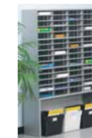
Casier de tri autoporteur

Tables modulaires. Nos tables de rangement, de base et utilitaires peuvent servir de façon indépendante, ou ensemble dans un flot global d'exécution d'opérations. Munies d'une tablette, de portes coulissantes ainsi que d'une serrure et d'une clé, les tables de rangement combinent force et durabilité à espace de rangement et polyvalence.