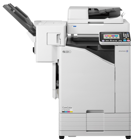
Bac de réception tri décalé et agrafage

Les guides papier s'ajustent automatiquement en fonction du type de papier utilisé.