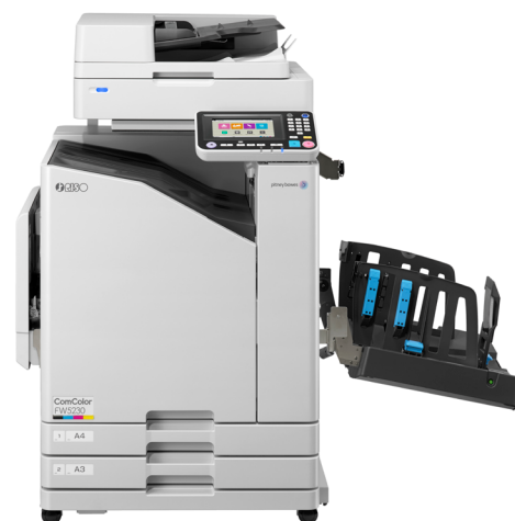
Bac de réception grande capacité avec ajustement automatique