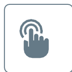
2.2inch Touch Screen