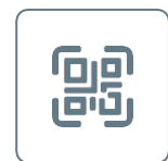
ZEBRA 2D Scan Engine